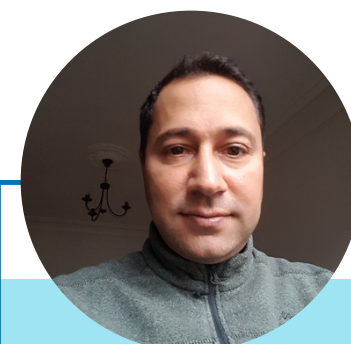
Moutaa Bouchenak Logistique